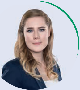
von Vanessa Giese

Sicher kennen Sie die Schlagzeilen über Mietenwucher, Mietendeckel und Co., welche schon seit geraumer Zeit in den Medien herumgeistern.