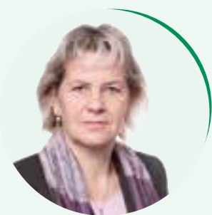
von Cornelia Koppe