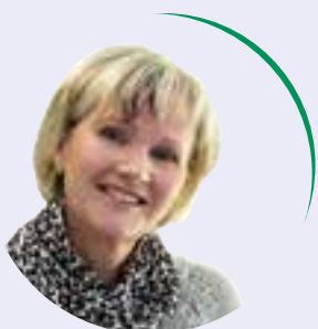
von Birgit Berger

Zu einer Busreise lud die Wohnungsgenossenschaft ihre Mitglieder und Bewohner nach Bernau ein. Am 3. Juni, einem sonnigen Sonntag, begann unsere Fahrt mit dem Busunternehmen Braunmiller am Westausgang des Dessauer Hauptbahnhofes.