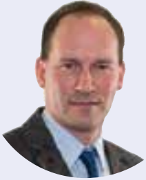
von Michael Wermter

Das Jahr 2018 hat anspruchsvolle Baumaßnahmen im Plan.