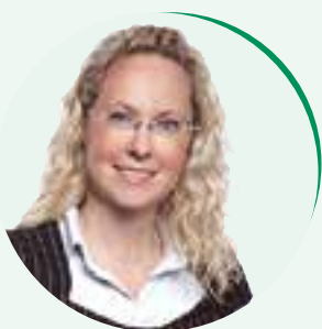
von Stefanie Roye

Mehr Bewegung für Grundschüler, das soll das Ziel der Kindersprintveranstaltungen sein. Im Mittelpunkt steht dabei ein computergestützter Laufparcours, der in Zeiten von Facebook, Twitter & Co. den Kindern wieder mehr Freude an der Bewegung vermitteln und langfristig zum Sporttreiben animieren soll. Vom 18.-22. Juni 2018 konnten sich Schüler in